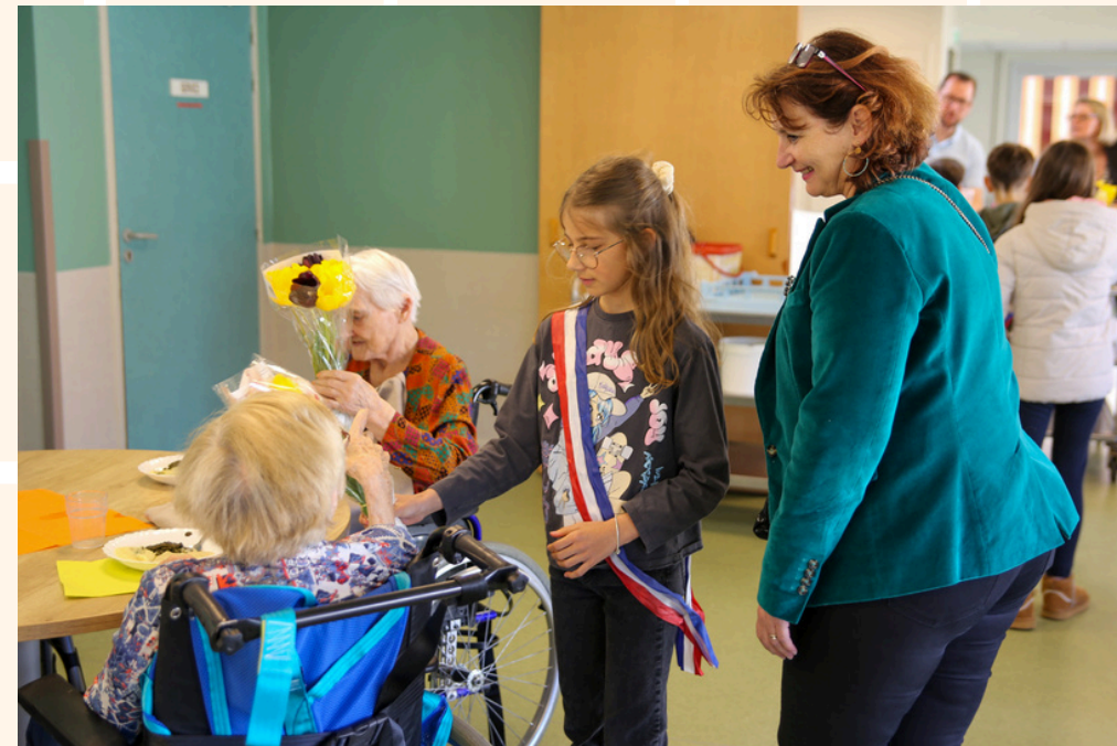
Distribution des tulipes à la maison de retraite